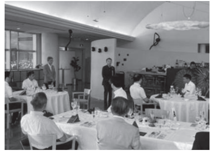
令和5年度に実施したセミナー、企業見学、会員交流会の様子